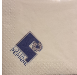
Lottaperinneliitto on teettänyt kahviserviettejä, joita voi ostaa tilaisuuksissamme (2,50 €/20 kpl).