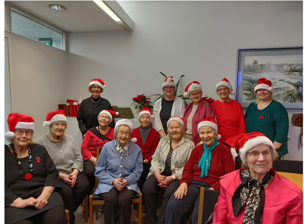
Lottakerholaiset avustajineen iloisissa tunnelmissa ja joululounaalla seurakuntatalolla 18.12.2025.