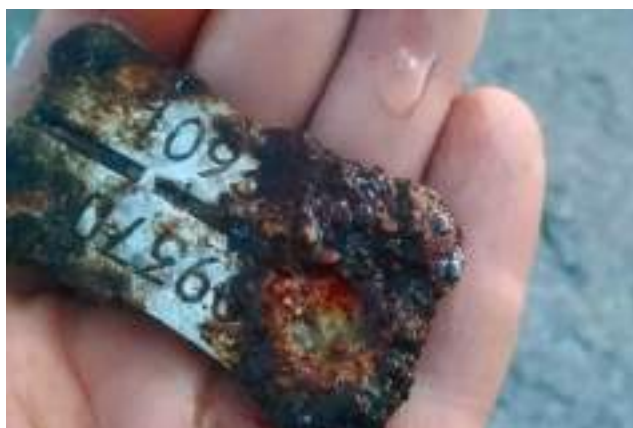
Maastoetsinnöissä 2021 Teikarsaaresta löydetty suomalaisen sotilaan tuntolevy osoittautui kuuluneeksi tykkimies Orvo Karviselle.