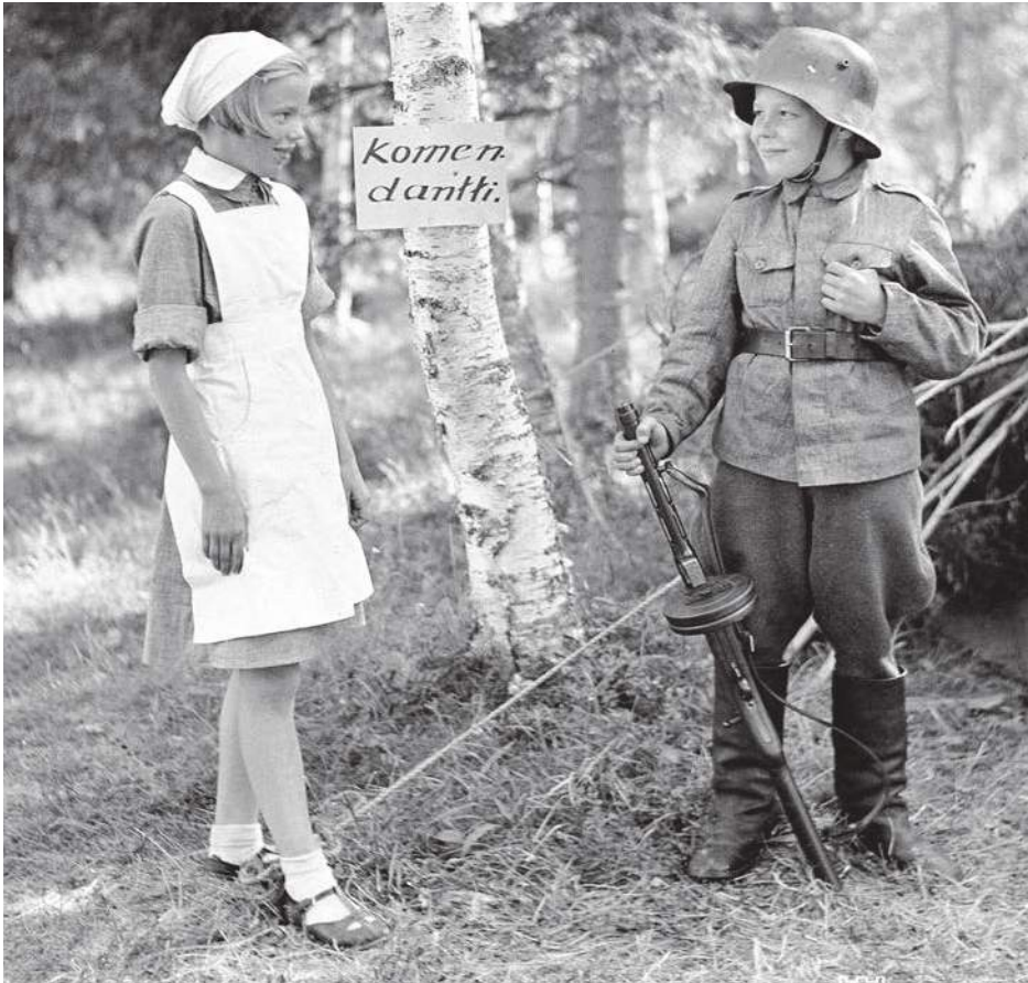
VII AKE:n pikkulotta ja sotilas-poika "siellä jossakin" Tohmajärvellä heinäkuussa 1941.

Nuoret ja lapset joutuivat sotiemme aikana osallistumaan kotirintaman sotaponnistuksiin ja usein myös vaarallisiin tehtäviin. Nuoret olivat kotirintaman apuna kaikessa mahdollisessa ja joskus mahdottomissakin työrupeamassa.