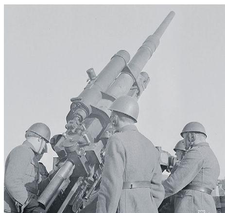
Santahaminan it-patteri helmikuussa 1944.