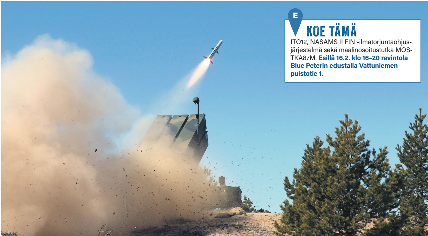
Tulta putkesta. Ilmatorjuntaohjusjärjestelmä NASAMS II FIN.