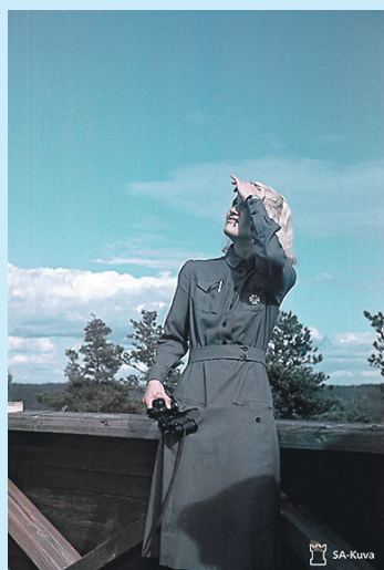
Lotilla oli merkittävä rooli ilmapuolustuksessa.

Ilmatorjuntamuseon näyttelyt ovat esillä Digimuseossa helmikuun alusta 2024 digimuseo.fi