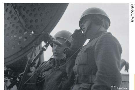
Venäläiset rynnäköivät Lauttasaaren eteläkärjessä sijainnutta johtopatterin "Puistoa" vastaan kolmesti ensimmäisen pommitusyön aikana. Kuvassa patterin saksalainen tutka "Irja".

●●●● VIHOLLINEN MENETTÄÄ 13 POMMIKONETTA, JOISTA PUDOTUKSIA NELJÄ, KAKSI TEKEE PAKKOLASKUN JA SEITSEMÄN TUHOUTUU ONNETTOMUUKSISSA. ●●●● HELSINGIN SANOMAT 8. HELMIKUUTA: "VÄESTÖN KESKUUDESSA EI ILMENNYT MINKÄÄNLAISTA HERMOSTUMISTA."