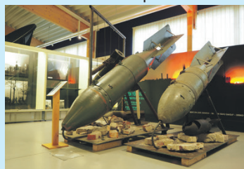
500 kilon neuvostopommi on esillä Sanomatalon Käytävägalleriassa.