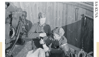
Suomisen Ollina tunnettu näyttelijä Lasse Pöysti sai tulikasteensa 17-vuotiaana sotilaspoikana Taivaskallion patterilla 26.2.1944.

Lisäksi monella varusmiehellä on kokemuksia kaupallisten lennokkien käytöstä ja jopa harrastuspohjaa.