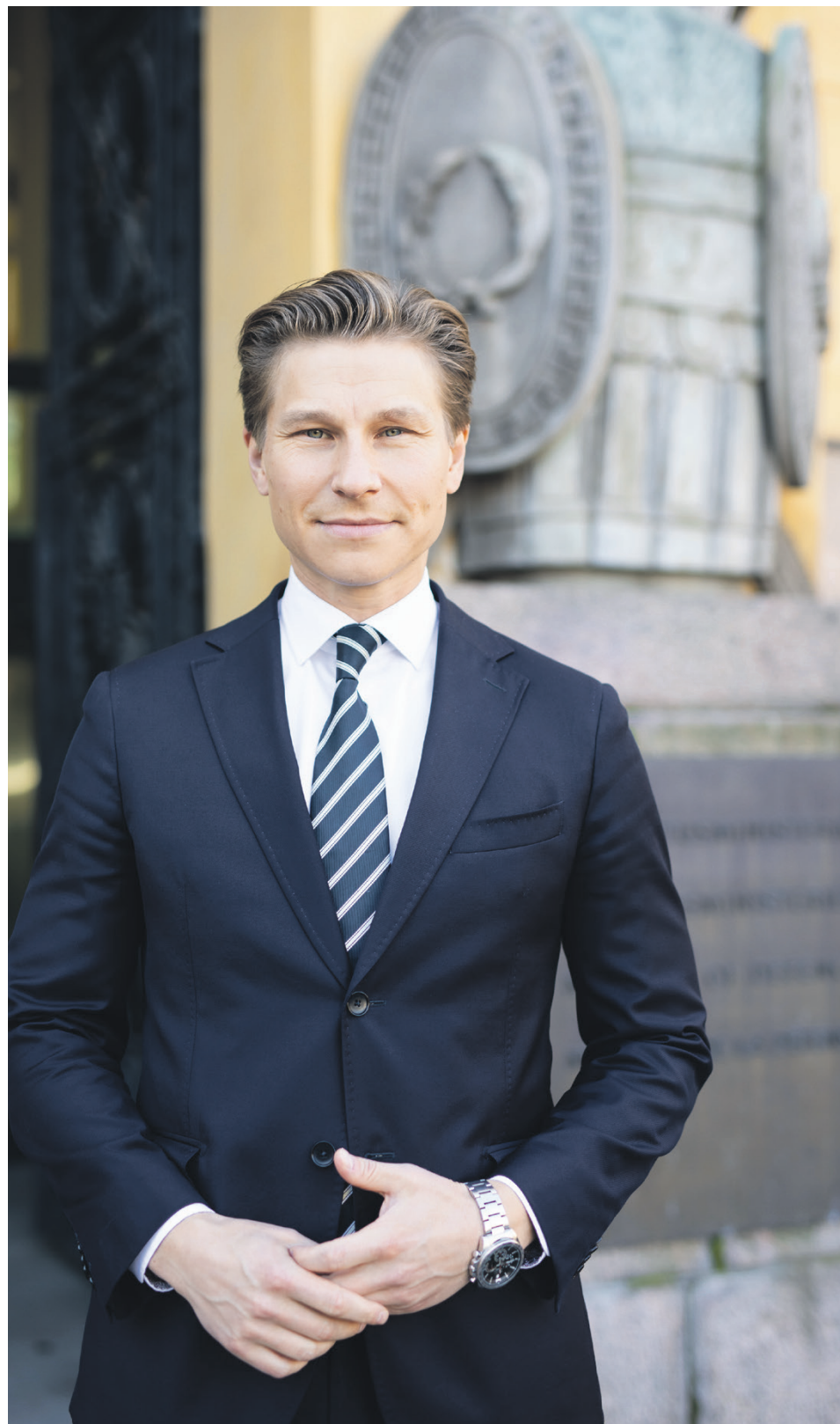
Puolustusministeri Antti Häkkänen ukki oli sotaveteraani ja mummi rintamalotta.

ja kehittämisen puolesta.” Kuinka paljon Nato-jäsenyys rauhoittaa puolustusministeriössä? ”Kyllä se rauhoittaa. Olemme siellä, mihin kuulumme. Varoisin kuitenkin antamasta kuvaa, että ”Nato hoitaa Suomen puolustuksen ja voimme kohdistaa voimavaramme muualle”. Eurooppalaisittain olemme asevoimien koon ja suorituskyvyn mittarilla isohko jäsenmaa. Tämä edellyttää jatkuvaa panostusta puolustukseen ja vähintään nykytasosta puolustusbudjettia. Nato laskee Suomen varaan paljon. Emme halua olla turvallisuuden kuluttaja, vaan sen tuottaja.” Kuinka arvioitte Venäjän reaktioita Suomen Nato-jäsenyyteen tähän asti nähdyn perusteella? ”Toistaiseksi Venäjän reaktiot ovat olleet odotetun kaltaisia. Siellä on ilmeisesti hyväksytty tapahtuneet tosiasiat.” Mikä Puolustusvoimien tulevaisuuden hanke on erityisen tärkeä Suomen puolustuskyvylle?