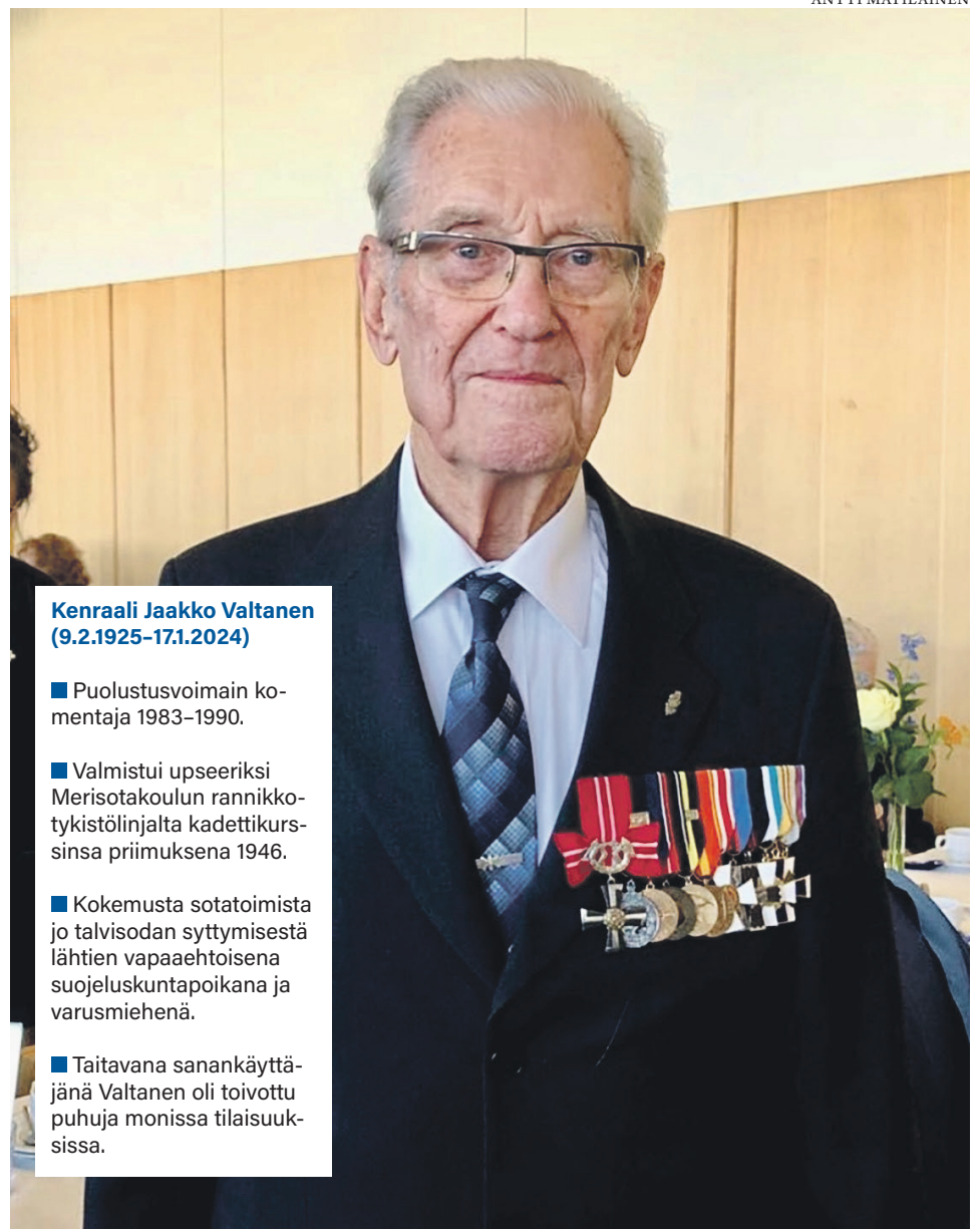
Kenraali Jaakko Valtanen (9.2.1925–17.1.2024)

Jaakko Valtanen oli viimeinen puolustusvoimien