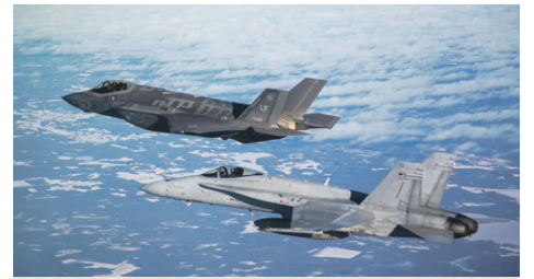
Lockheed Martin F-35 Lightning II on häivehävittäjä.

ITO12, NASAMS II FIN -ilmatorjuntaohjusjärjestelmä sekä maalinosoitustutka MOS-TKA87M. Esillä 16.2. klo 16-20 ravintola Blue Peterin edustalla Vattuniemen puistotie 1.