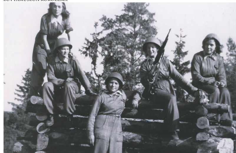
Valonheitinlotat asentavat kalustoa Helsingissä keväällä 1944. Lotat saivat uniformukseen sillahaalarit ja italialaista mallia olevat kypärät. Terni-kivääri on annettu lotille henkilökohtais- ta puolustautumista varten.

len päivän aikana ja samalla kuorma-autolla lotat pääsivät lomapäivinä kaupunkiin.