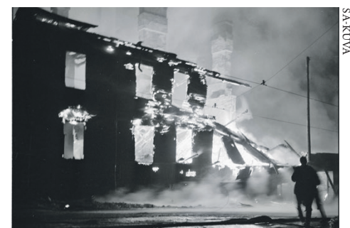
Porthaninkadulla palaa 17.2.1944.