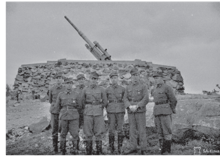
Santahaminassa sijaitti kaksi raskasta ilmatorjuntapatteria. Kuvassa 66. raskaan it-patterin upseereita ja aliupseereita lokakuussa 1944.

●●●● KUOLONUHREJA 25. TUHOUTUNEITA TALOJA 22, VAURIOITUNEITA RAKENNUKSIA 53. ●●●● VIHOLLINEN MENETTÄÄ VIISI POMMIKONETTA ALASAMMUTTUNA. KOLME KONETTA TUHOUTUU ONNETTOMUUKSISSA. ●●●● HELSINGIN SANOMAT 18. HELMIKUUTA.: ”YLI 400 VIHOLLISKONETTA POMMITTI HELSINKIÄ – HELSINGIN POMMITUS OLI SELVÄ TERRORIHYÖKKÄYS.”