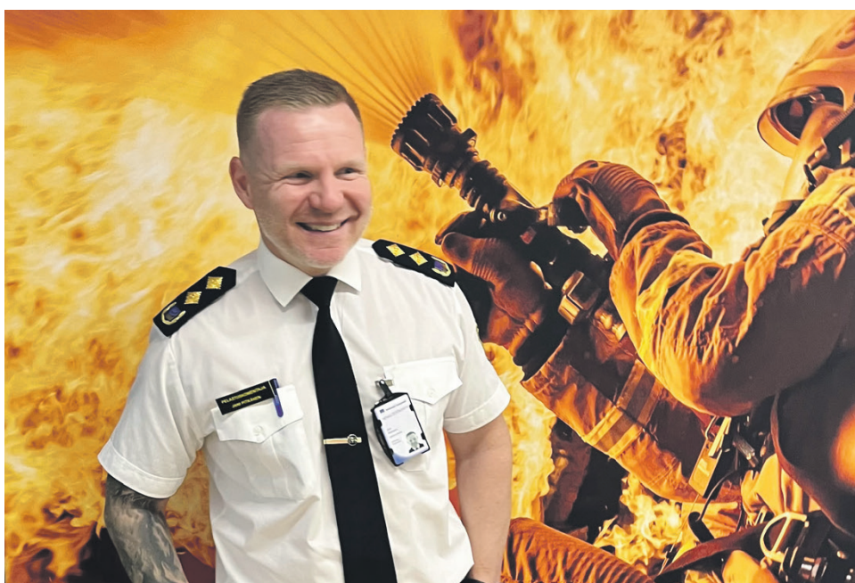
Pitkäsen mukaan väestönsuojelu on Suomen lippulaivoja, mutta hälytysjärjestelmää ja suojien kuntoa pitää kohentaa.