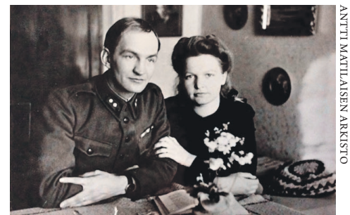
ANTTI MATILAISEN ARKISTO