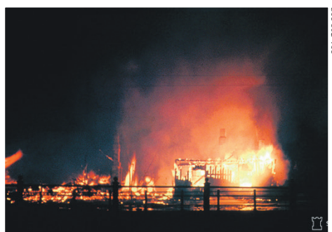
Helsingin keskustassa palaa 7.2.1944.

●●●● VIHOLLINEN MENETTÄÄ 13 POMMIKONETTA, JOISTA PUDOTUKSIA NELJÄ, KAKSI TEKEE PAKKOLASKUN JA SEITSEMÄN TUHOUTUU ONNETTOMUUKSISSA. ●●●● HELSINGIN SANOMAT 8. HELMIKUUTA: "VÄESTÖN KESKUUDESSA EI ILMENNYT MINKÄÄNLAISTA HERMOSTUMISTA."