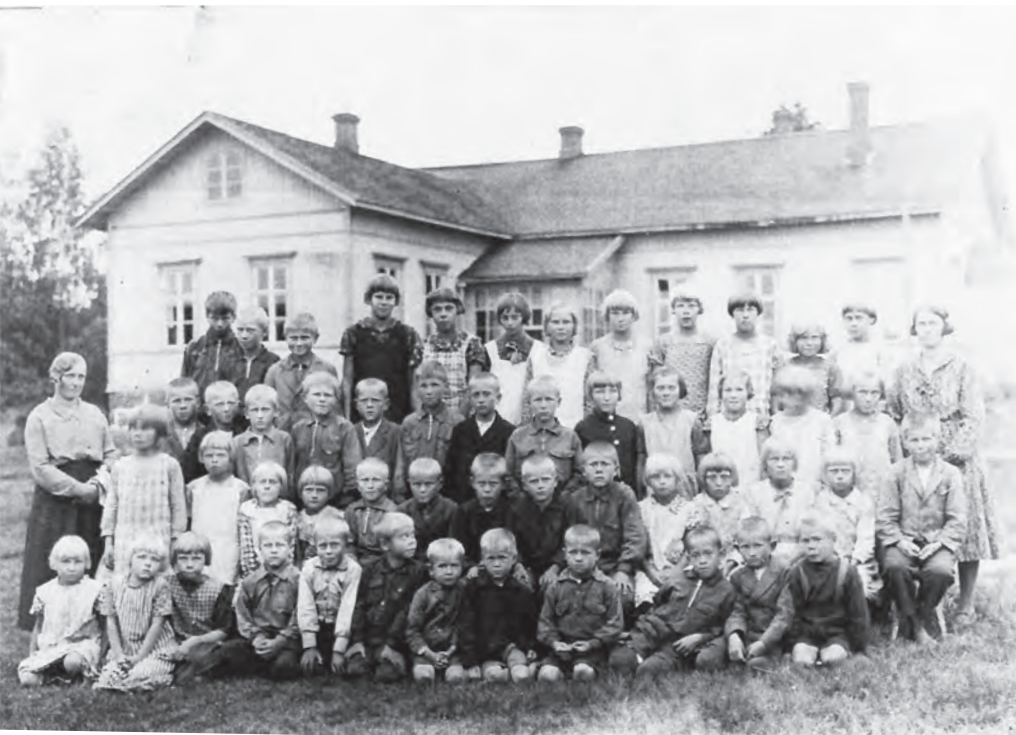
Orslahdessa oli paljon lapsia. Kuvassa Orslahden koulun oppilaat 1934.