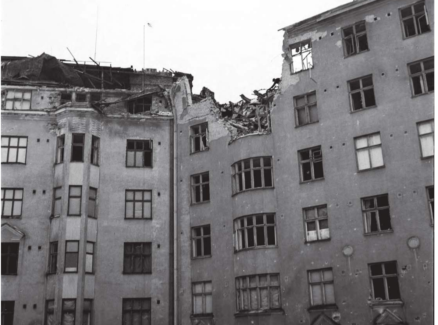
Helsingin pommitusvaurioita 6.–7.2.1944 tapahtuneessa pommituksessa. Helsinki 8.2.1944.

joka paikassa oli niin hirveästi särkyneitä ikkunoita, että oli vaikea kulkea. Välillä ihan kahlasimme lasissa. Kotitaloni oli kuitenkin säilynyt, ikkunatkin olivat ehjät. Joskus viiden maissa aamulla tulin kotiin.