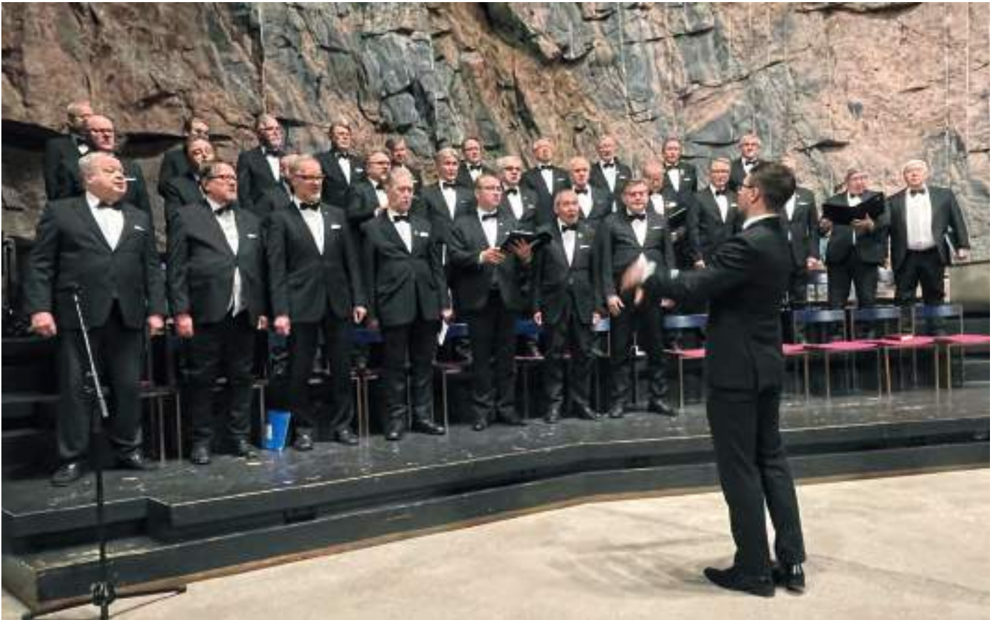
Perinneyhdistyksen ja Viipurin Lauluveikkojen perinteistä itsenäisyyspäivän aaton kirkkojuhlaa vietettiin 5.12.2023 Tempeliaukion kirkossa. Täpötäysi kirkkosali sai nauttia Lauluveikkojen ja Puolustusvoimien varusmiessoittokunnan sykähdyttävistä musiikkiesityksistä.