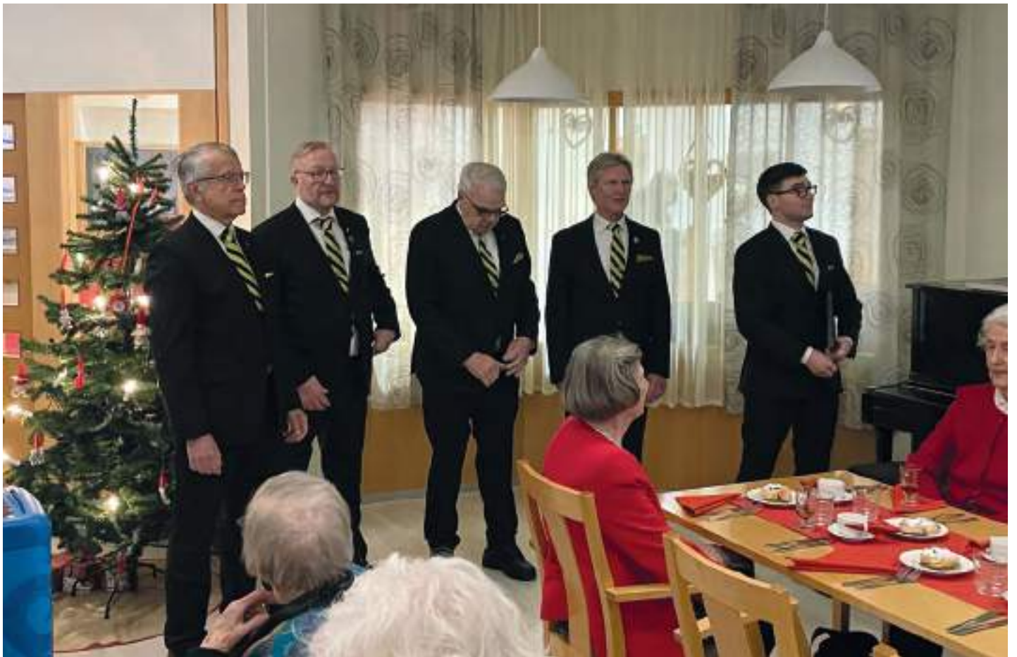
Sotainvalidien Veljesliiton Helsingin piiri ja perinneyhdistys järjestivät yhteistyössä jäsentensä joulujuhlan 11.12.2023. Hyvä musiikki, maittava jouluateria ja hyvät ystävät takasivat onnistuneen illan ja johdattivat Joulun odotukseen.