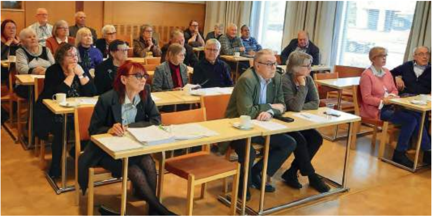
Helsingin Rintamaveteraanit ry piti vuosikokouksensa 6.10.2022. Kokouksessa käsiteltiin veteraanijärjestöjen yhteistyötä siirryttäessä perinneaikaan. Helsingin Rintamaveteraanit ry siirtää veteraani- puoliso- ja leskijäsenensä 1.1.2023 toimintansa aloittavaan Sotien 1939 – 1945 pääkaupunkiseudun perinneyhdistykseen.