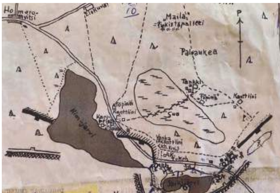
Karttapiirros Homorovitsin alueesta. Täällä Harju sai ensimmäisen kerran tuntuman vihollisen toimintaan.

Kesä oli kaunis, mutta muuten elämä ei ollut innostavaa jatkuvan vihollisen