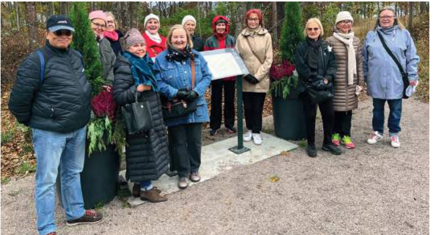
Tiistaina 4.10. vierailivat Lauttasaaren Martat Lottalehdossa. Käynnin yhteydessä kertoivat Lauttasaari-Seuran historiatyöryhmän jäsenet alueella jatkosodan aikana toimineen Puistopatterin toiminnasta. Alustavien suunnitelmien mukaan on Martoilla tarkoitus jo ensi Itsenäisyyspäivänä suorittaa kunniakäynti Lottalehdossa ja sytyttää kynttilät Suomea puolustaneiden naisten kunniaksi. Käynnistä tullaan tekemään perinne, joka kutsuu mukaan eri ikäluokkia ja yhdistää esimerkillään kunnioittamaan maamme puolustajia.