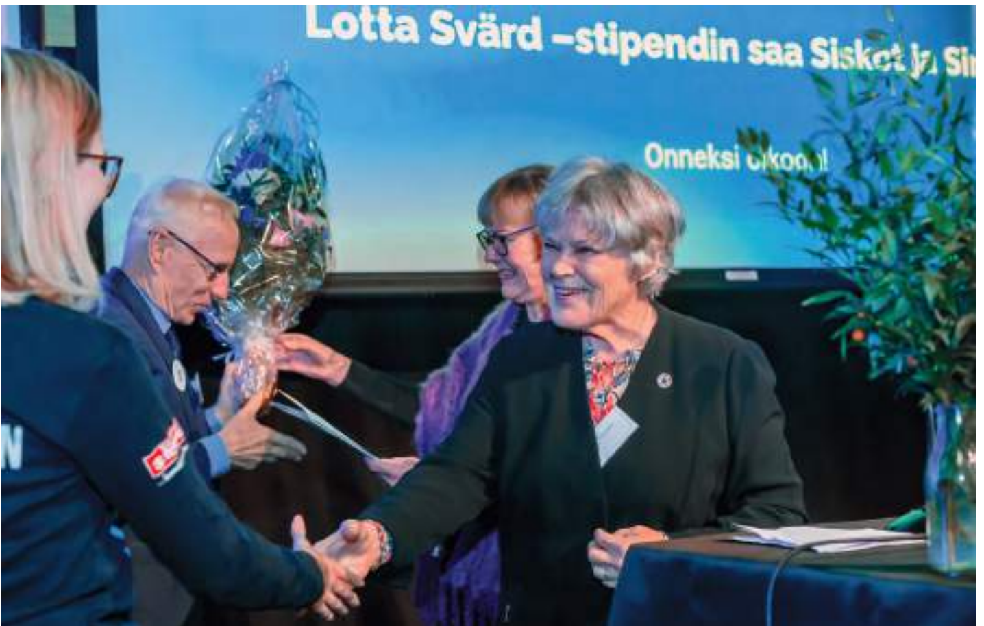
Ministeri ja pikkulotta Elisabeth Rehn luovutti järjestyksessään ensimmäisen Lotta Svärd -stipendin Siskot ja Simot ry:lle, jonka tavoitteena on käynnistää laaja-alainen välittämisen kansanliike. Toiminnan ideana on järjestää tapaamisia, joissa nuoremmat sukupolvet kohtaavat tasavertaisesti ikääntyneitä ja ikääntyneet nuorempia henkilöitä. Stipendi luovutettiin Lotta Svärd säätiö järjestämässä seminaarissa 24.10.2022.