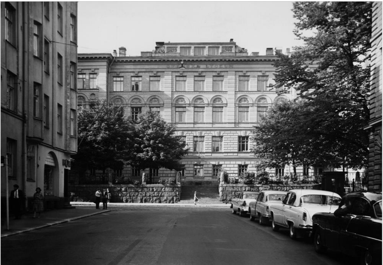
Alun perin Svenska lyceumin taulut paljastettiin koulun silloisissa tiloissa Liisankadulla.

Alun perin koulu oli avoinna vain pojille, mutta vuonna 1968 alkaneessa muutoksessa se yhdistettiin vastaavasti tytöille perustetun Svenska flickskolan i Helsingforsin eli ruotsalaisen tyttökoulun kanssa. Näin alkunsa saanut Helsingfors svenska samlyceum eli Helsingin ruotsalainen yhteislyseo muutti vuonna 1972 pois Liisankadulta ja Kruunuhaasta tyttökoulun tiloihin Töölöön osoitteeseen Arkadiankatu 24. Sotavuosina talossa oli toiminut sotasairaala.