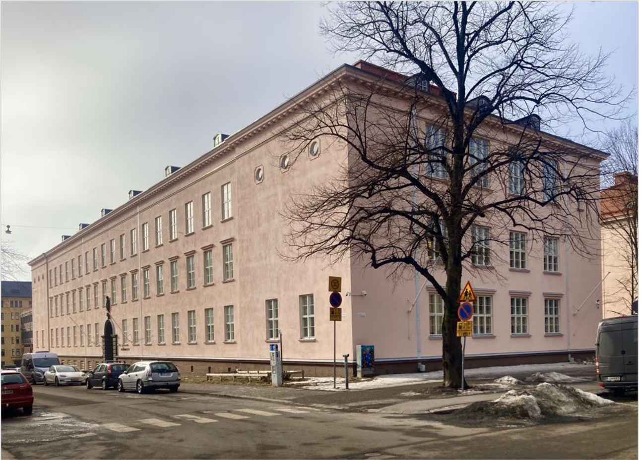
Tällä hetkellä Arkadiankatu 24 toimii Taivallahden koulun väistötiloina. Svenska lyceumin Pro Patria-taulut sijaitsevat Lapuankadun pääsisäänkäynnistä sisään tultaessa vasemmalla puolen.

Kahdeksanvuotinen Svenska lyceum otti tehtävänsä sivistyksen majakkana tosissaan: sen opetusohjelmasta löytyi mm. kalligrafiaa sekä klassisia kieliä latinasta kreikkaan, minkä lisäksi oppilailla oli mahdollisuus hankkia kielitaitoja niin venäjässä, ranskassa, englannissa kuin saksassa.