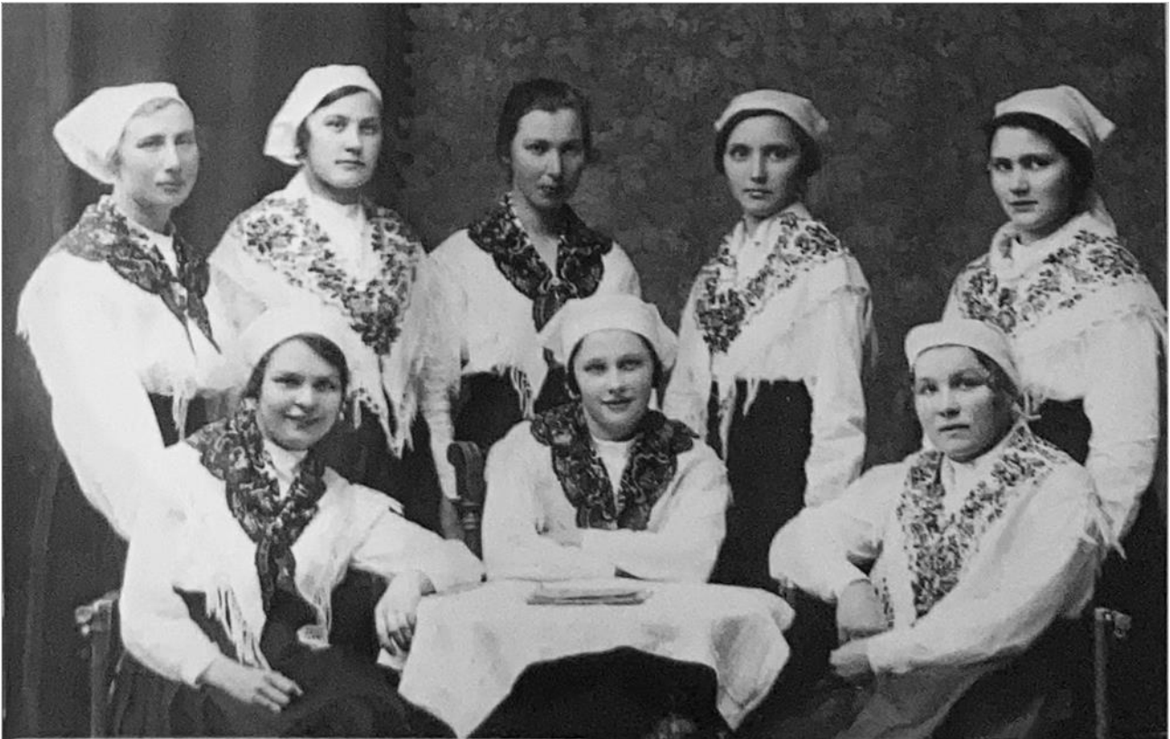
Nuorisoseuran naisia Helsingin pitäjän kansallispuvuissaan ennen sotavuosia.

Vilkkaimpien vuosikymmenten tasolle ei toiminta yllä, mutta yhä tänäänkin jäseniä on 170.