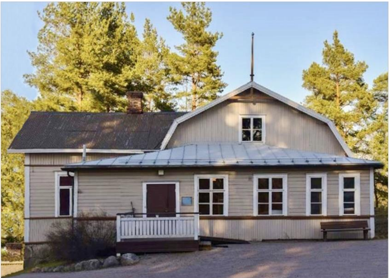
Vanda Ungdomsförening rf:n Pro Patria-taulu on kunniapaikalla sen seurantaloon Björkhemin juhlasalin seinällä, pianon yläpuolella.

Seura perustettiin jo vuonna 1909, seuran jäsenille rakkaaksi tulleen, kahdesta huoneesta ja keittiöstä koostuneen Björkhemin se hankki heti seuraavana vuonna konkurssipesästä 6025 markan hintaan (nykyrahassa vajaa 30 000 €). Niinpä jo ensimmäistä vuosikokousta päästiin viettämään oman katon alla. Siitä lähtien talo on isännöinyt aktiivista toimintaa teatteriesityksistä kursseihin ja lastenjuhlista erilaisiin kilpailuihin. Tätä nykyä sitä vuokrataan myös ulkopuolisille esim. häiden pitopaikaksi.