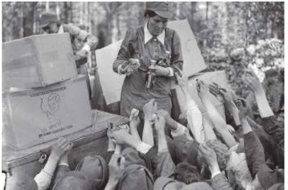
Etulinjaan vierailulle tulleen liikkuvan sotilaskodin antimille oli ottajia Tohmajärvellä heinäkuussa 1941.

Kirjoitus perustuu Maija Ikonen Turun yliopistossa vuonna 2022 julkaistuun pro gradu -tutkielmaan "Palvelen poikiani viimeiseen saakka – sotilaskotisisarten kokemukset talvi- ja jatkosodassa." Tutkielma on vapaasti luettavissa internetissä Turun yliopiston utupub.fi -sivustolla.