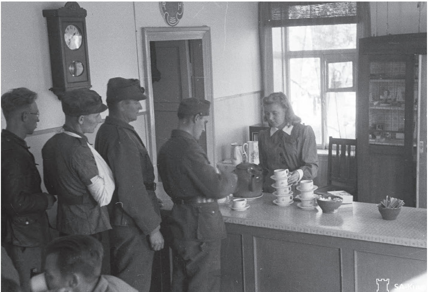
Äänislinnalaisessa sotilaskodissa oli jonoa lokakuussa 1943.

muun muassa opinnot ja perhe. Viimeistään jatkosodan perääntymisvaihe tarkoitti useimmille työn päättymistä, kun suurin osa sotilaskodeista oli jätettävä niille sijoilleen Neuvostoliiton hyökkäyksen alla. Sekasortoisessa tilanteessa sotilaskotityöstä tuli vaikeaa, mutta toimintamahdollisuuksia tarjosivat jälleen liikkuvat sotilaskodit. Jotkut sisarista jatkoivat rintamapalvelustaan vielä Lapin sodassa.