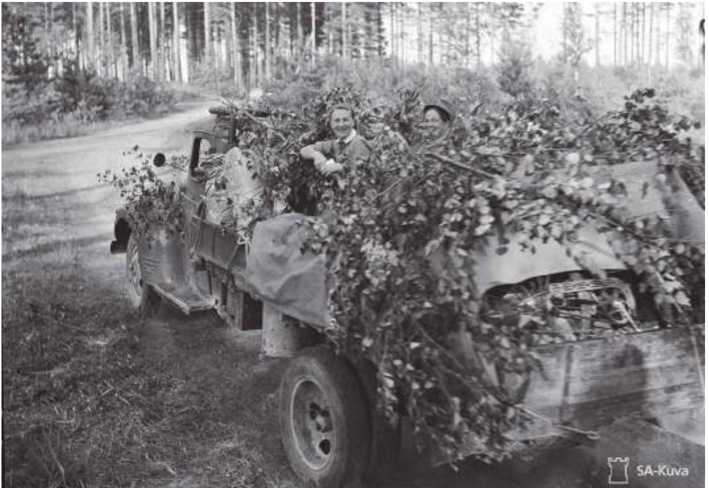
Sotilaskoti etulinjoilla naamioidussa kuorma-autossa Myllyniemen lähetyvillä 4.7.1941. SA-kuva.

Vaikuttaa siltä, että useimmat sisaret palvelivat rintamalla niin kauan kunnes he itse toivoivat pääsevänsä takaisin siviiliin. Siviiliin heitä veti