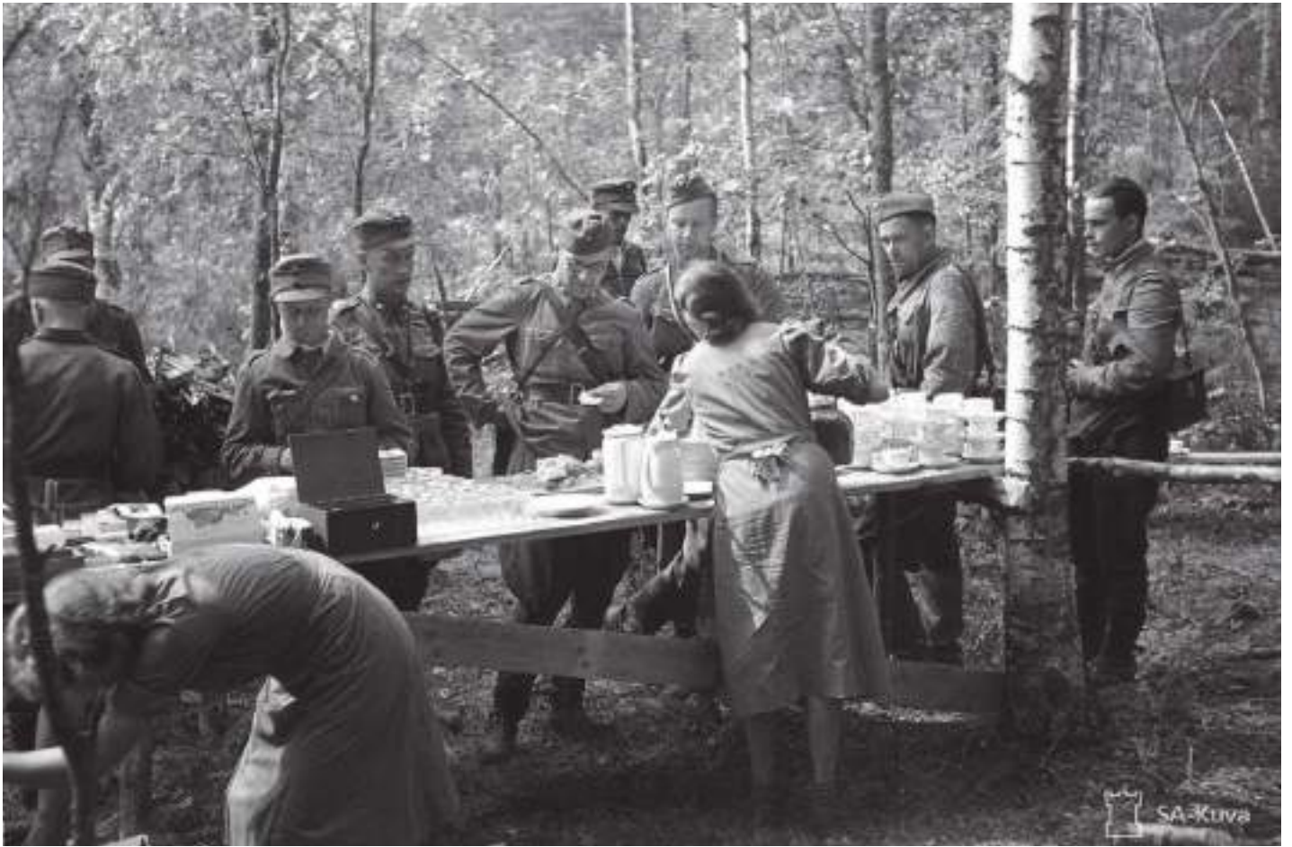
Sotilaskotisisarten myyntipiste ulkoilmassa Kannaksella jatkosodan hyökkäysvaiheessa elokuussa 1941.

kertaistus. Rintamasisaret itse näkivät, että heidän työnsä merkitys perustui toisen ihmisen kohtaamiseen. He huomioivat jokaisen sotilaskotiin tulevan sotilaan henkilökohtaisesti, kannustivat, tukivat, rohkaisivat ja olivat läsnä. Armeijan hierarkiat eivät ylittäneet sotilaskodin seinien sisäpuolelle, sillä sotilaskodissa jokainen oli tasavertainen sotilasarvosta riippumatta.