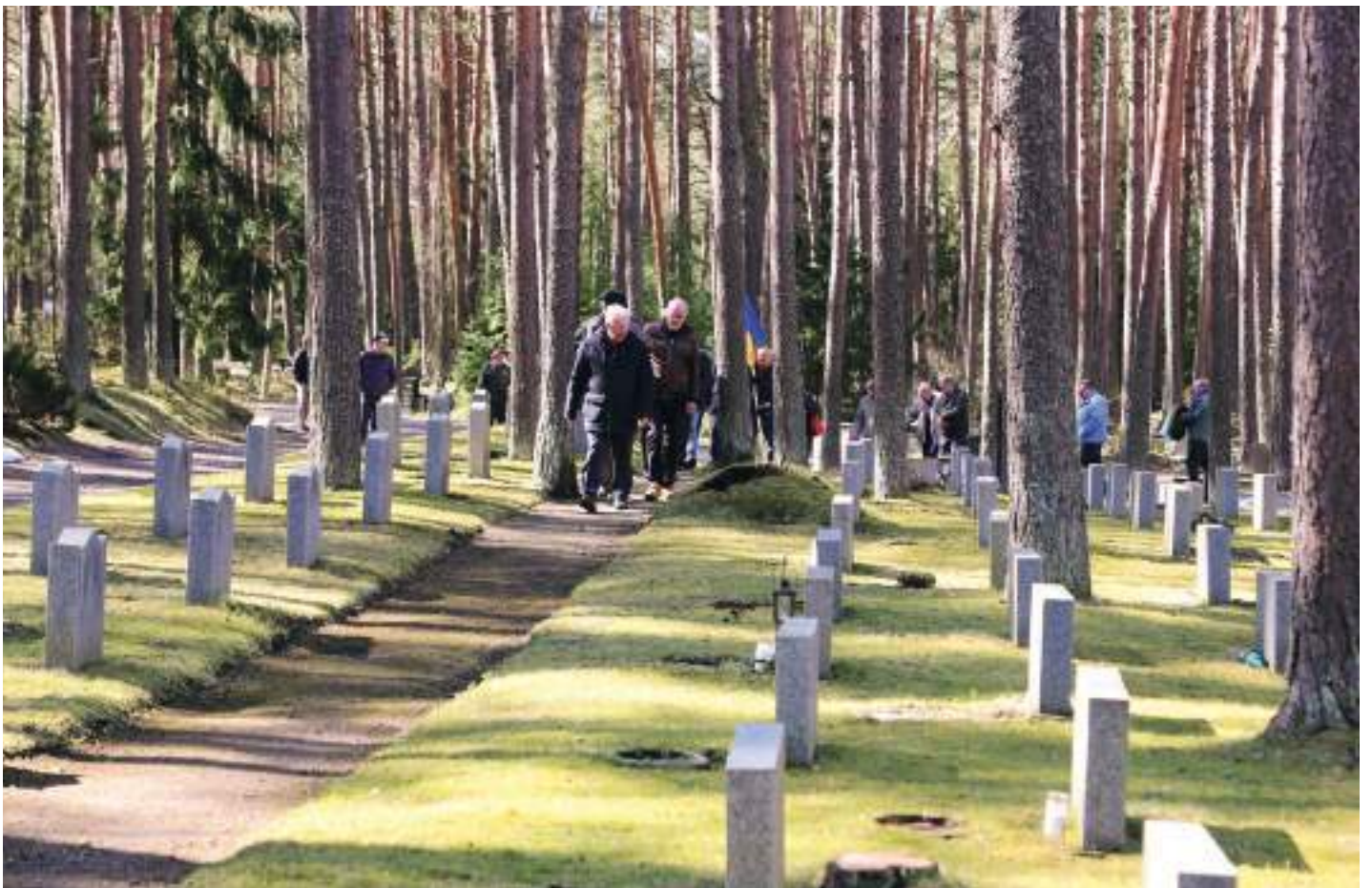
Usean tunnin uurastus on takana. Muistolehto on saatu siivottua talven jäljiltä.