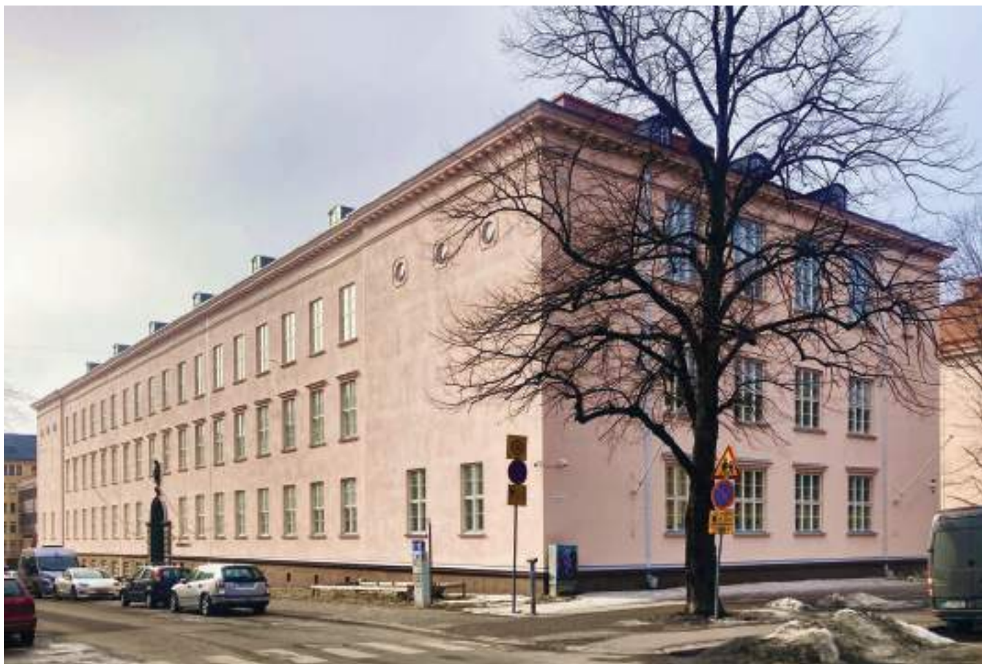
Svenska lyceumin Pro Patria-tila sijaitsee tällä nykyä Arkadiankatu 24:n pääsisäänkäynnin portaikossa.

”Äidin puolelta pappa haavoittui talvisodassa. Ainoastaan toinen muunainen oli tainnut jäädä jäljelle niin että hänet oli jo ehditty viedä ruumis-