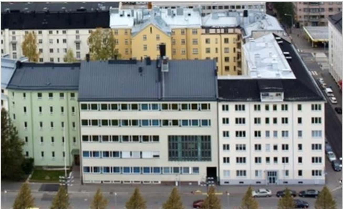
Töölön yhteiskoulu toimii kuvan keskimmäisessä ja vasemmanpuoleisessa rakennuksessa osoitteessa Urheilukatu 10–12. Pro Patria-taulut löytyvät sen viidennestä kerroksesta sijaitsevasta juhlasalista, lavan vasemmalta puolen.

TYK:issä on opintiansä aloittanut monta oman jälkensä maan historiaan jättänyttä nimeä: mm. kansanedustaja Ben Zyskowitz , Helsingin apulaispormestarinakin vaikuttanut Nasima Razmyar , laulajatähti Hector sekä muotoilija-kuvanveistäjä Tapio Wirkkala . Vieläkin suurempia nimiä löytyy TYKin taulusta: ilman heitä kun ei meillä olisi koko maata. Sotamiehistä lentäjäsankareihin, perheenisistä ministeriperheen vesoihin... ja jopa yksi Mannerheim-ristin ritari! Lisäksi heidän jälkensä näkyy Helsingin katukuvassa vielä tänäkin päivänä.