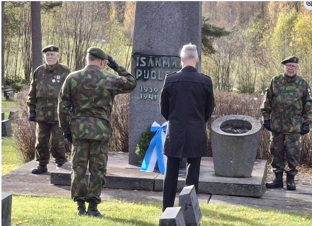
Kuvatekstit: Kesällä lottien haudat saivat Konnevedellä Lotta-Svärd-tunnuk-sensa ja lokakuussa vietettiin sotaveteraanien alueellinen kirkkopyhä perinteisin menoin.