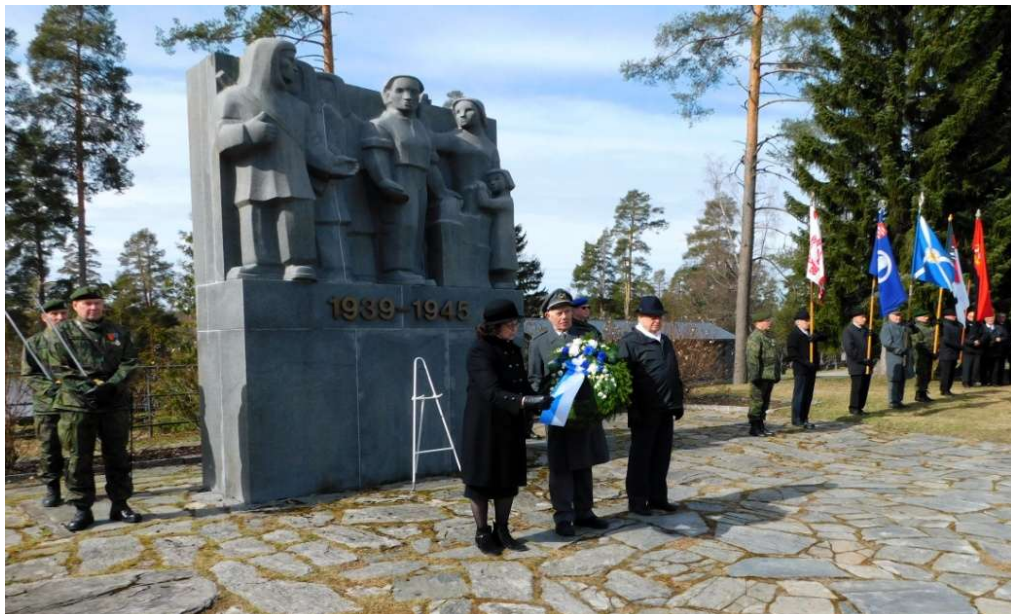
Kuvateksti: Kansallisen veteraanipäivän seppeleenlasku Viitasaarella

27.4.-25 Kansallinen Veteraanipäivä. Kirkossa messu, jonka jälkeen kunniaikänti sankarihaudalla ja seppeleen lasku. Juhla seurakuntatalolla.