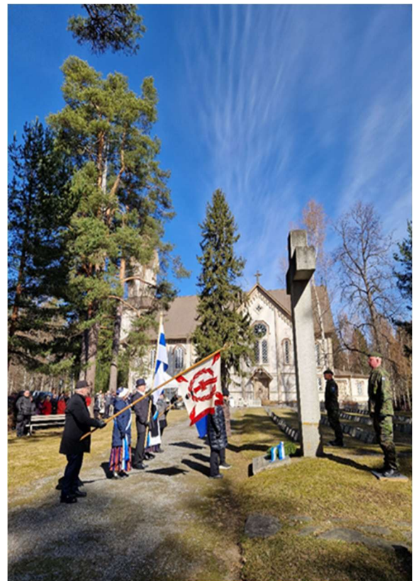
Kuvat seppeleenlaskutilaisuuksista Hankasalmella